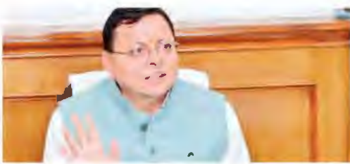
सीएम पुष्कर सिंह धामी।

सदन के भीतर सोने के बजाय अगर विपक्ष के साथी आपदा प्रभावितों के बीच जाकर सोते तो उनका कष्ट समझ आता। सदन की कार्यवाही अनिश्चितकाल के लिए स्थगित होने के बाद सीएम धामी मीडिया से मुखातिब हुए। उन्होंने कहा कि हम अवैध मंदरसों को लेकर अल्पसंख्यक